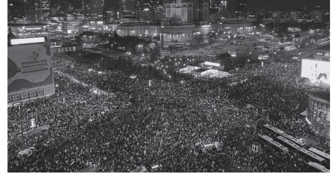
Polonya'nın Varşova kentinde kürtaj yasasını sıkılaştırma kararını protesto eden 150 bin kadın | 30 Ekim 2020

Anayasa Mahkemesi kararına göre kürtaja sadece gebeliğin kadının hayatını tehlikeye atması, tecavüz ya da ensest yaşanması durumunda izin verilmesi kadınların isyanına eşlik etti.