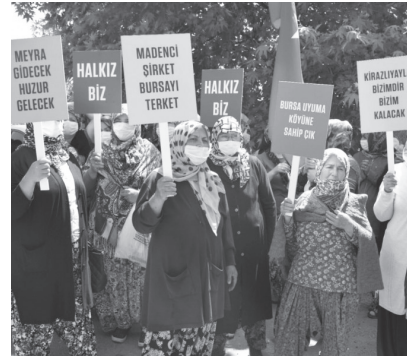
Kirazlıyayla'da direnen halka da sosyal mesafeye uymadıkları gerekçesiyle para cezası kesildi.