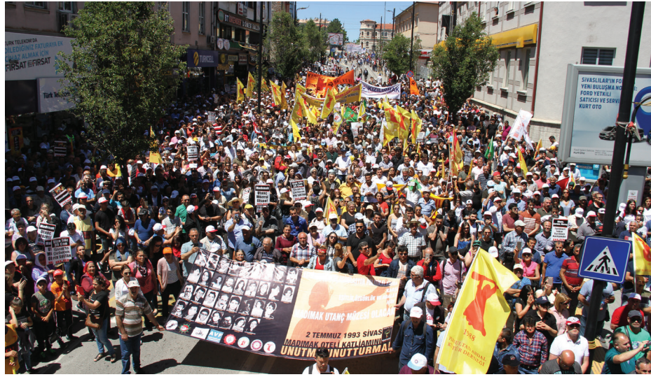
2 Temmuz 2019

Asimilasyon ve imha politikası egemen güçlerin Alevi topluluklarına karşı izlediği politikanın temel ayaklarını oluşturmaktadır. Bu noktada esas olan Alevilikle değil Alevi kitlelerin o günkü koşullarda iktidara karşı aldığı siyasal tutum egemenlerin yaklaşımında belirleyici bir rol oynamaktadır. Yani meselenin özü Alevi toplumların iktidar güçlerine karşı aldıkları pozisyonda yatmaktadır. Bu ikili politikadan hareketle egemenler kimi zaman Alevileri -en azından çekebilecekleri