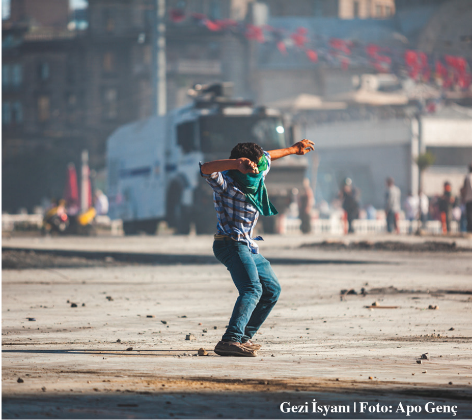
Gezi İşyanı | Foto: Apo Genç

“-muş gibi yapan muhalefetinin” dışında görece etkili bütün pratikleri yok saymaktadır. Çünkü içten içe, başta Kürtler olmak üzere halkın verdiği demokrasi mücadelesinin bastırılması için AKP ile birleşmektedir.