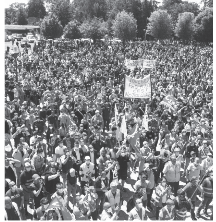
Fransa'da işçiler, nakit para krizini aşmak için Renault'un işçi çıkartmasını protesto etti. Sendika temsilcilerinin açıklamalarına göre 8 bin işçi protestolara katıldı.

Koronavirüs salgınında yaşanan talep düşüklüğü sebebiyle, Japon firmaların ülke içi ve dışındaki fabrikaları geçici süreliğine kapatması araç üretimini düşürdü. Otomobil üretim sektöründe